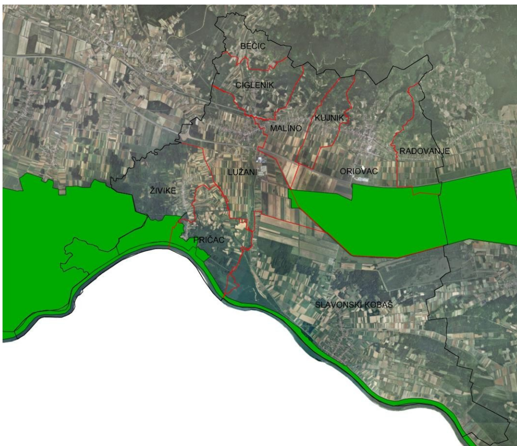
Slika 2. Zaštićena područja (Natura 2000)

Na području općine Oriovac postoje područja koja se nalaze u području ekološke mreže (Natura 2000)- prikaz slika 2; i to dio k.č. br. 3029 te k.č. br. 3021/1, 3022, 3023, 3024, 3025, 3026, 3027, 3028, 3038, 3039, 3040, 3041, 3042, 3043, 3044, 3045, 3046, 3114, 3116, 3117, 3118, 3120, 3121, 3122, 3123, 3124, 3125, 3126, 3127, 3151, 3152, 3153, 3154, 3155, 3156, 3157, 3158, 3159, 3160, 3161, 3162, 3163, 3168, 3169, 3170, 3171, 3172, 3173, 3174, 3175, 3176, 3177, 3178, 3179, 3183, 3184, 3185 i 3186 u k.o. Oriovac; k.č. br. 35/2, 91/1 i 455/1 u k.o. Pričac; k.č. br. 801, 802, 803, 804/1, 832, 834, 835 i 836 u k.o. Radovanje; k.č. br. 845/4, 845/5, 935/2, 970 i 1045/2 u k.o. Živike