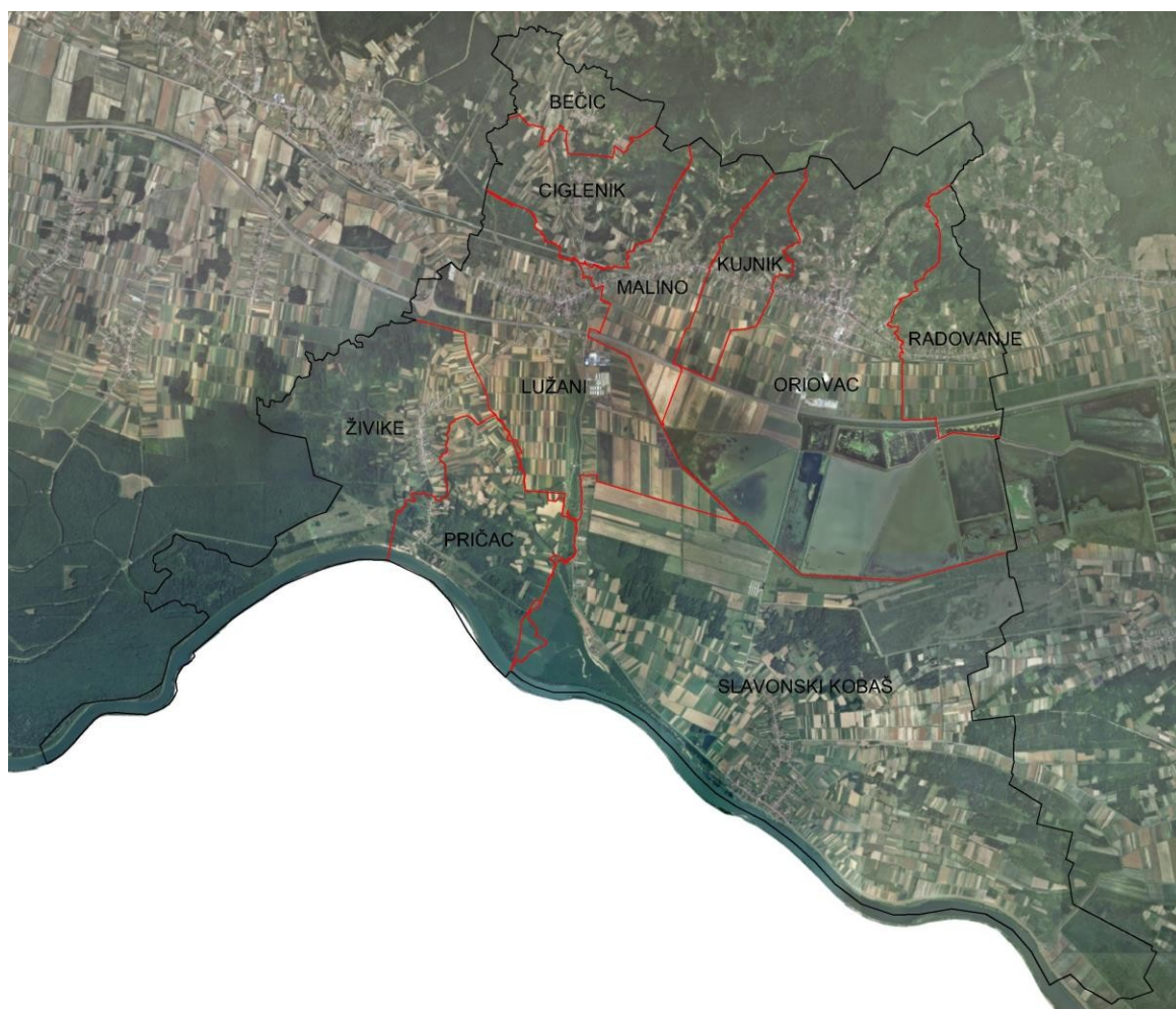
Slika 1. Općina Oriovac sa prikazanim katastarskim općinama

Općina se prostire na 99 km 2 , a sastoji se od 10 katastarskih općina i to: Bečić, Ciglenik (sjeverno uz Orljavu), Kujnik, Lužani, Malino, Oriovac, Radovanje (na glavnoj županijskoj cesti) te Pričac, Slavonski Kobaš i Živike (južno na Savi) kako je prikazano na slici 1.