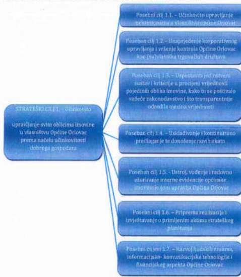
Slika 2. Kaskadiranje strateškog cilja upravljanja općinskom imovinom

Kao potencijalno rješenje navedenih problema teška se rezultat prijedloga izmjena određenih zakonskih i podzakonskih propisa čime bi se omogućilo nastavak adekvatnog upravljanja općinskom imovinom.